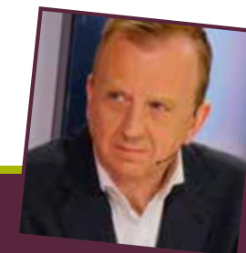
Lukas Jacobs burgemeester

“Het restbedrag - ca. 80.000 euro - wordt nu verder verdeeld onder de verenigingen om hun omzetverlies van de coronacrisis te compenseren. De verenigingen moeten daarvoor een verlies van 25% aantonen op de omzet van 2020 tegenover 2019. Deze regeling werd gunstig geadviseerd door de betrokken adviesraden en is goedgekeurd door de Kalmthoutse gemeenteraad.” De aanvragen worden voor de zomervakantie uitbetaald.